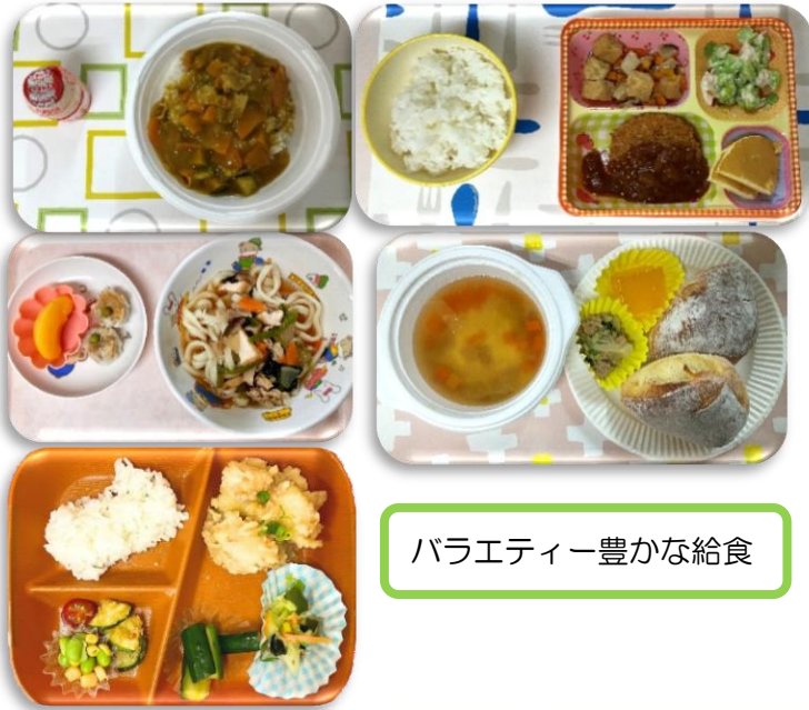
バラエティー豊かな給食